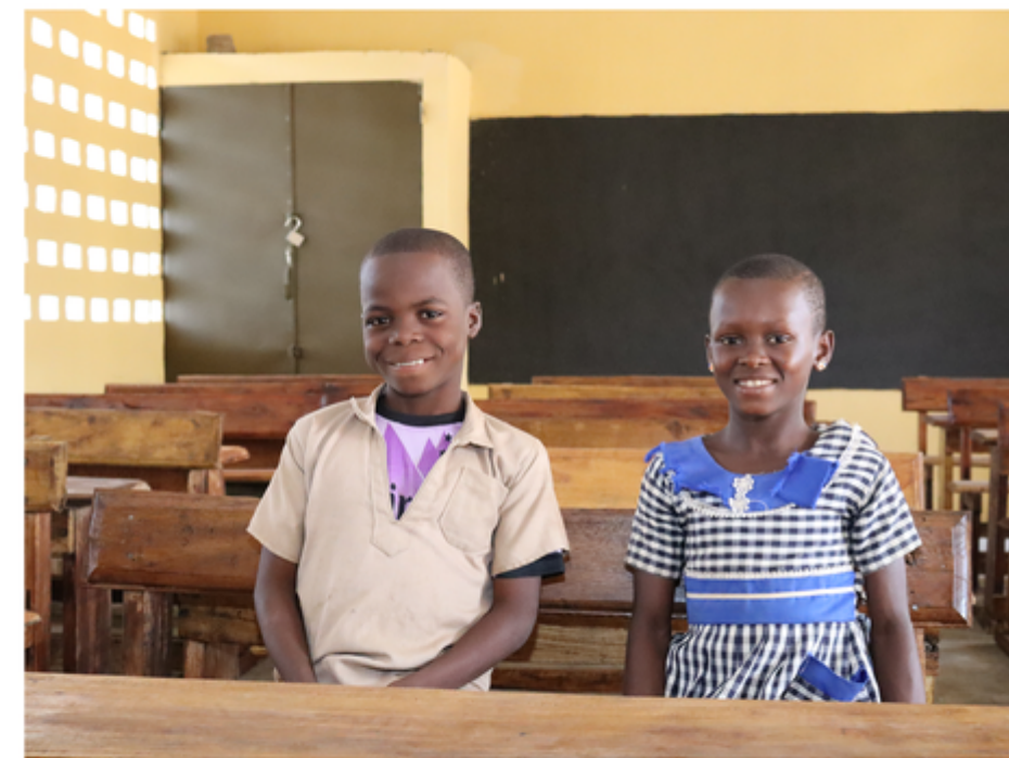
El CNS, la ICC y Hershey construyen infraestructura escolar moderna en Drissapé, Costa de Marfil